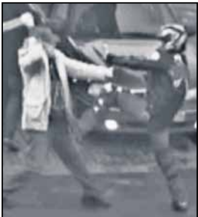
Видеокамеры зафиксировали момент драки

Напомним, в своих показаниях о драке с байкером 66-летний народный артист России подробно описал своего обидчика. — Одет он был в корот-